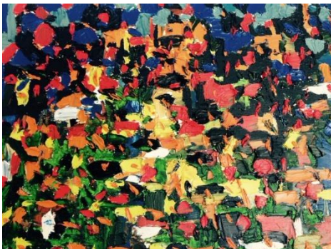
Al otro Lado del terruño

Tous les matins une nouvelle lumière, et avec elle, un nouveau paysage. De donde vienen los días , est le fruit des journées passées à observer le mouvement constant du ciel sur la cordillera, à m'interroger sur les dimensions spatiales de cette interaction.