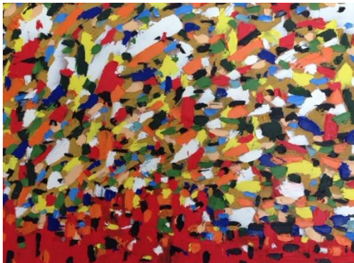
De donde vienen los días

Avec ses tableaux Il explore une cartographie émotionnelle ; les couleurs et sensations du lever du jour au printemps ou bien l'amertume des bougies des réunions clandestines chez ses parents sont présents dans ses travaux. On pourrait croire à une représentation marquée par la distance, mais c'est le transit, le mouvement constant, qui prédomine dans ses formes : tous les exils... les siens.